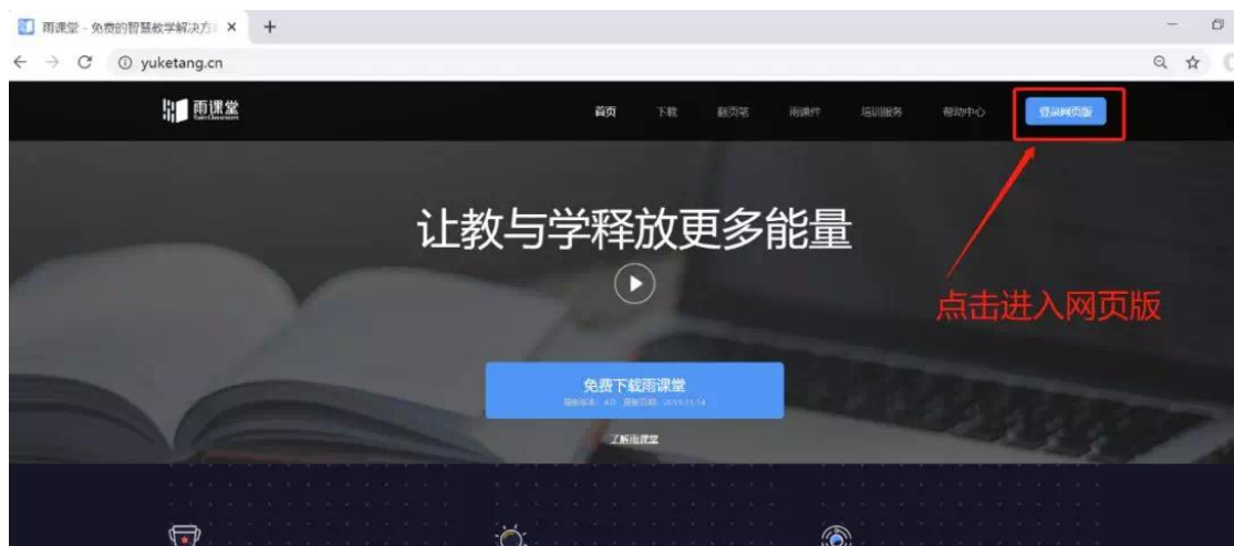
雨课堂网页版登录界面

进入课程观看页面后，按照图 2 的箭头指示点击进入当前直播页面，选择【进入大屏显示】，如图 3 所示，即可进入大屏直播页面，如图 4 所示。当教师发送习题时，请回到图 3 界面或者在手机界面上进行作答。